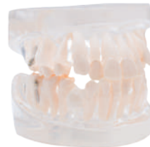
MODELO PARA PRÁCTICA DE ORTODONCIA 24 dientes y 4 tornillos/ Incluye oclisor. Ref.0905116