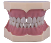
TIPODONTO TIPO FRASACO® AG-3 32 dientes atornillables/ Destornillador. Ref.0905000