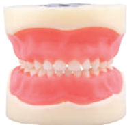
TIPODONTO TIPO NISSIN® 24 dientes atornillables/ Destornillador. Pletinas Ref.0905000-3