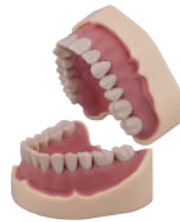
TIPODONTO TIPO FRASACO® ANA-4 28 dientes atornillables/ Destornillador. Pletinas Ref.0905000-5