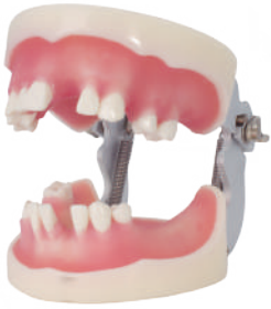
TIPODONTO PARA IMPLANTES ARTICULADO 16 dientes fijos/ Para práctica implante. Ref.0905107