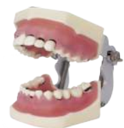
TIPODONTO DE PERIODONCIA CON ARTICULADOR 28 dientes atornillables/ Con articulador y pletinas. Ref.0905110