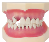
MODELO DE PERIODONCIA 32 dientes atornillables Ref.0905109