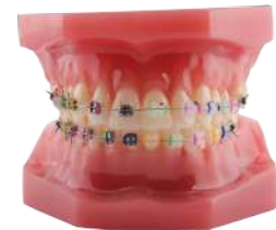
MODELO BE BRACKET Con brackets metálicos y de zafiro/ Incluye oclisor / Encía dura. 28 dientes fijos. Ref.0905102