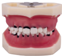
TIPODONTO DE PERIODONCIA SIN ARTICULADOR 28 dientes atornillables/ Pletinas. Ref.0905125