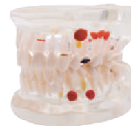
MODELO TRANSPARENTE CARIES 32 dientes/ Modelo demostración para conocer posibles casos Ref.0905115