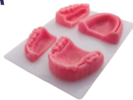
MODELO SUTURA SILICONADO Material de silicona. Para prácticas quirúrgicas dentales Ref.0905124