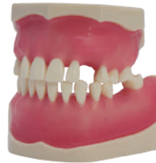
TIPODONTO PARA CIRUGÍA TIPO KAVO® Dientes incrustados sobre encía dura. Práctica de implantes, recesión, extracción, osteotomía... Ref.0905112