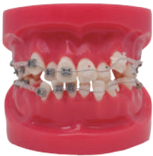
MODELO DE BRACKET METAL ZAFIRO 24 dientes/ Incluye oclisor. Ref.0905117