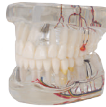
MODELO IMPLANTE CON NERVI Demostración para implantación de dientes, alguno desmontable. Ref.0905111