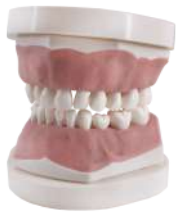
TIPODONTO TIPO FRASACO® AK-6 24 dientes atornillables/ Destornillador/ Placa base Ref.0905000-8PB