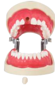
TIPODONTO ENDO 28 dientes atornillables/ Articulador y pletinas Ref.0905127