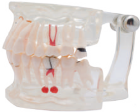
MODELO DENTAL TRANSPARENTE CON IMPLANTE Demostración para conocer los posibles casos de práctica odontológica. Contiene 31 dientes no desmontables. Ref.0905114