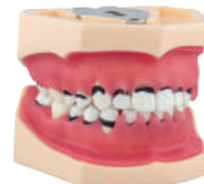
MODELO DE PERIODONCIA COMPLETO 28 dientes atornillables/ Pletinas. Ref.0905113