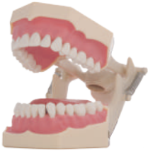
TIPODONTO TIPO FRASACO® AG-3 32 dientes atornillables/ Articulador/ Destornillador. Ref.0905100