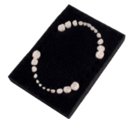
Ref. 0905000-1 x32ud para AG-3 Ref. 0905000-10 x24ud para AK-6 Ref. 0905000-4 x24ud tipo Nissin® Ref. 0905000-6 x28ud para ANA4