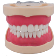
TIPODONTO TIPO COLUMBIA® 32 dientes atornillables/ Con articulador. Ref.0905000-9